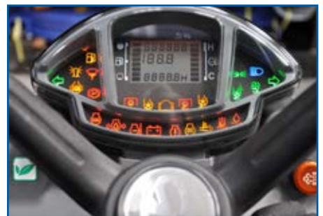
Cruscotto Digitale di ultima generazione