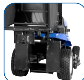
Ampio tunnel di scarico