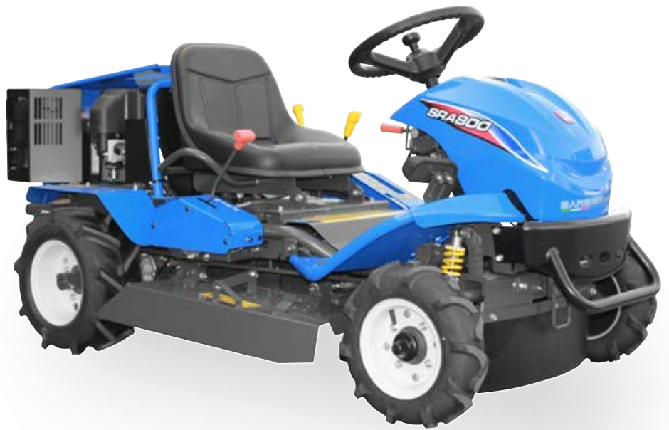
Protezione "Forestal" (opzionale)