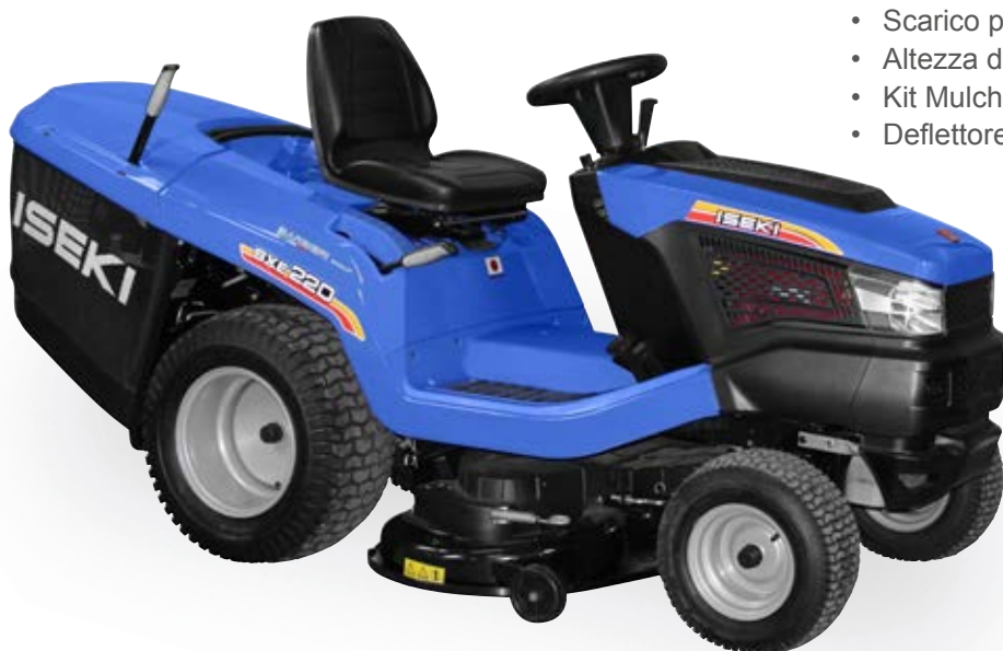
Frizione a lama elettromagnetica