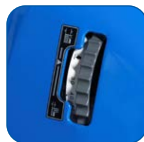
Selettore per l'altezza di taglio

Il modello SXG324 offre potenza, prestazioni e produttività insuperabili. Il motore diesel da 1123cc fornisce una coppia elevata con una efficienza che si traduce in un sensibile risparmio di combustibile. Il piatto di 1.220mm (48") grazie ad una maggiorata sovrapposizione delle lame, garantisce una qualità di taglio superiore e una maggiore produttività.