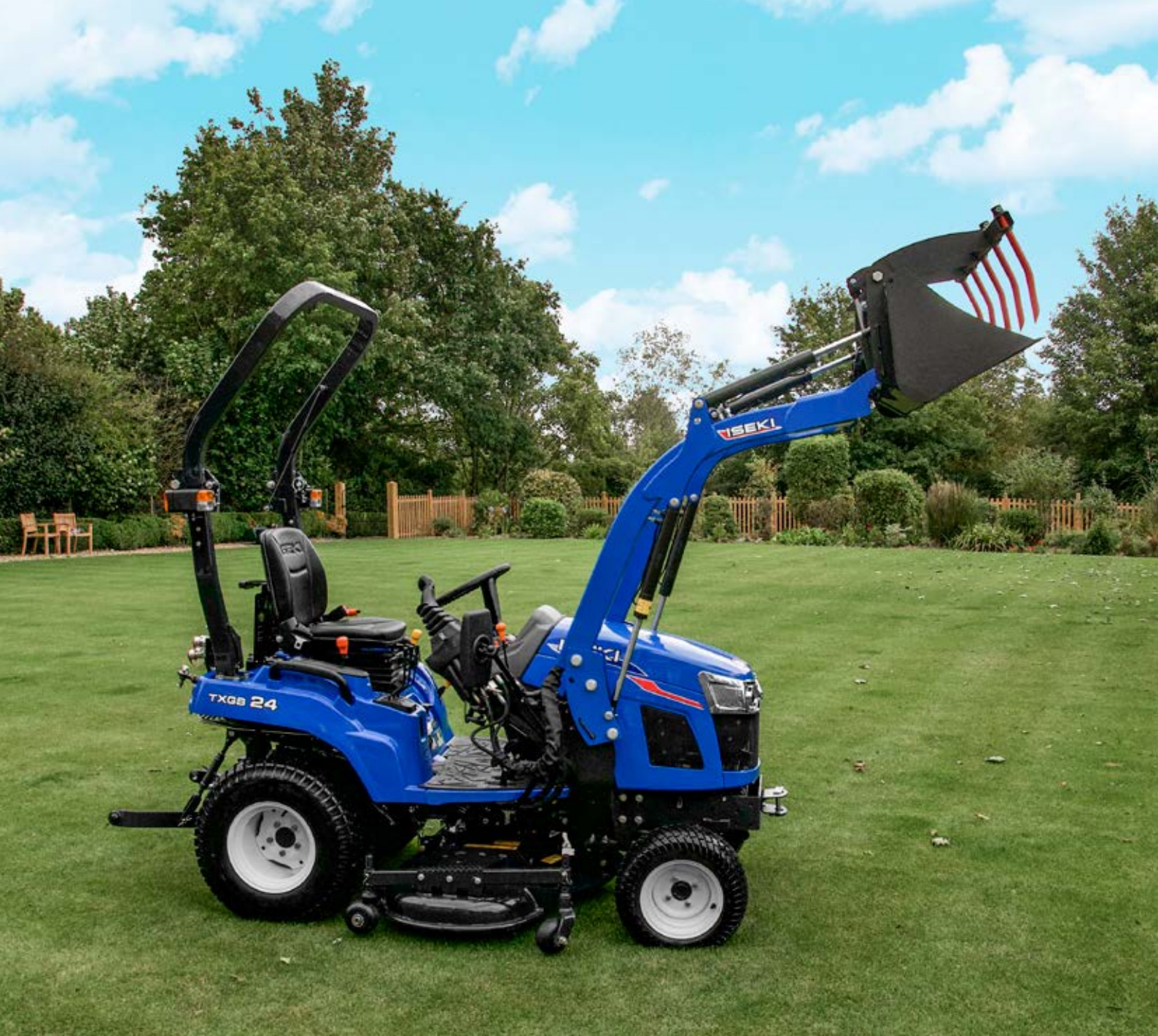
Leva distributori "Joystick" (option)