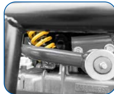
Assale Anter. con Sospensioni "a Molle"