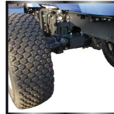
Protezione del cilindro di sterzo e nuovo assale anteriore 4 ruote motrici con 1.200 Kg di capacità di carico.