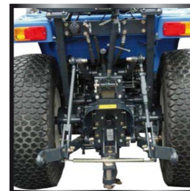
Sollevatore posteriore con attacco a tre punti Cat. 1 e 1.100 Kg di capacità alle rotule.