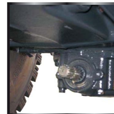
La PTO ventrale è di serie per la versione con rollbar posteriore.