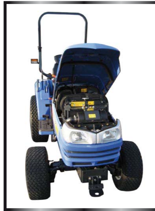
Grazie al cofano ribaltabile, l'utente può facilmente raggiungere il motore per la manutenzione ordinaria.