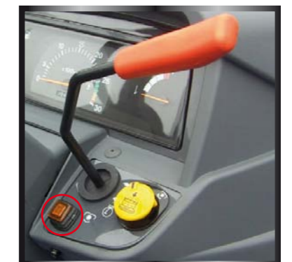
Comando inserimento della PTO che è indipendente con due modalità d'innesco, normale o soft (tasto cerchiato) con attrezzature ad alta inerzia