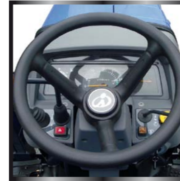
Il posto di guida è stato progettato "a misura dell'operatore". C'è ampio spazio per potersi muovere con agio e tutti i comandi sono a portata di mano garantendo così un controllo totale sulle operazioni.